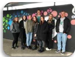
DIE SCHÜLER- VERTRETUNG