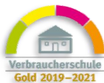
VERBRAUCHER- SCHULE GOLD